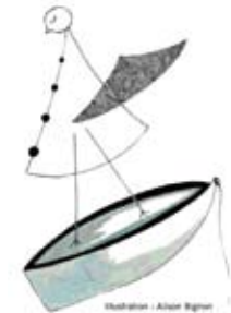
Illustration : Alison Bignon