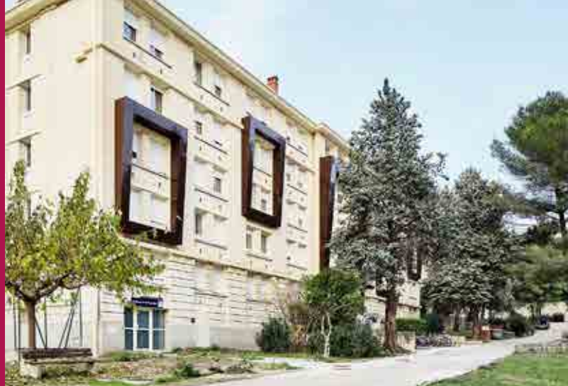
Cité U' Boutonnet

De janvier à août, en fonction des disponibilités de notre parc, 3 types de logements vous sont proposés, localisés dans différents quartiers de Montpellier