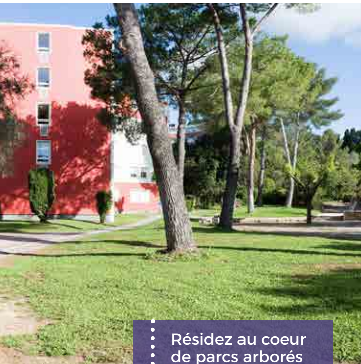
Cité U' Colombière

Résidez au coeur de parcs arborés exceptionnels