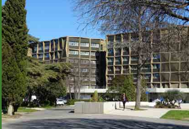
Cité U' Triolet