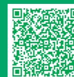
Photo : Crous Nantes - Pays-de-la-Loire

Renseignez-vous sur le site internet du Crous de Montpellier-Occitanie, rubrique : Se loger.