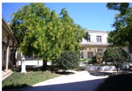
Photographie du site de construction - Etat actuel

Le patio - jardin public de La Panacée est conçu comme un lieu d'exposition et de performance à part entière. Inspiré des jardins intérieurs traditionnels montpelliérains, son aménagement sera régulièrement réinventé par les artistes paysagistes accueillis en résidence. Lieu central et public, à la fois intégré et autonome, il distribue l'ensemble de l'espace, en synthétisant tous les axes du projet de la Panacée dans sa forme comme dans ses contenus, en perpétuel mouvement : la créativité, la contemplation, la réflexion et la convivialité. Le lieu d'accueil, d'information et de restauration fera office de sas de décompression entre la rue et le jardin créatif grâce à une ouverture privilégiée.